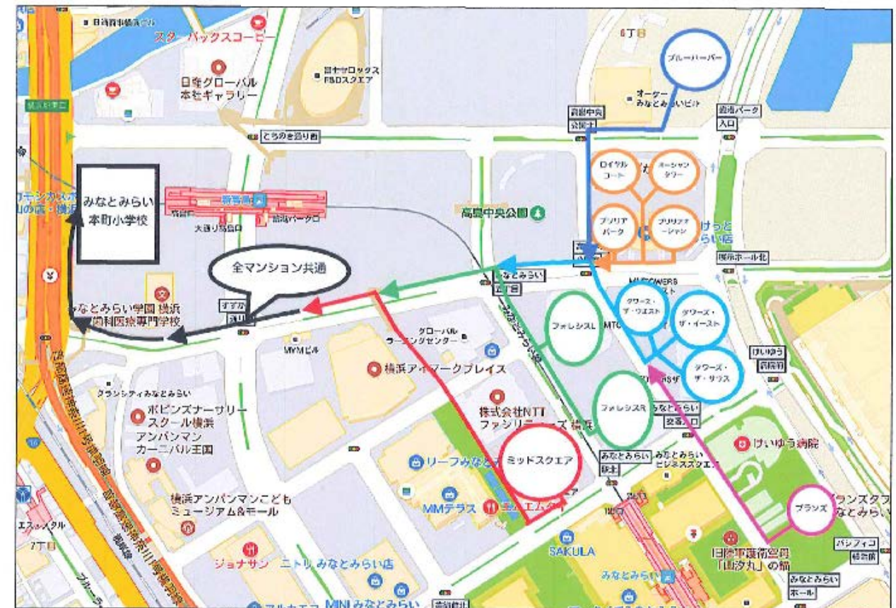
各マンションから共通の通学路までの経路案

(9月4日子ども安全委員会みなとみらいブロックの委員、前年度みなとみらいブロック代表による話し合いより)