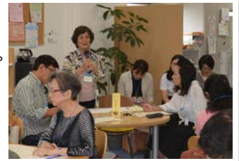
地域づくり大学校の様子