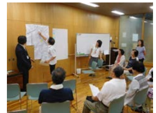
地域包括ケアシステム 地域での話し合いの場

・地域における様々な見守り活動を連携させるなど、民生委員・児童委員、「ふれあい会」等の見守り活動を支援します。