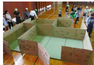
地域防災拠点訓練（区割り訓練）

・大規模な自然災害等の発生時に道路・下水道などインフラの緊急対応を的確に実施します。