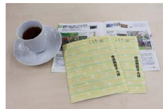
ことりっぶ横浜西区さんぽ

・大規模イベント開催時など来街者が増加する機会を捉え、企業等と連携したフォトコンテストを開催します。 ・「ことりっぶ横浜西区さんぽ（30年3月発行）」を活用して区の魅力を PR するなど、まちの回遊性を高めるための取組を進めます。