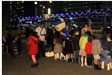
イルミネーション（自治会&公園愛護会）