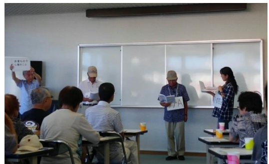
〈女性の視点で見た防災対策〉

寸劇を使い当事者になりき って課題を検討しました。 専門家が入ることにより普 段とは違う視点で課題検討 できるのがいいですね。