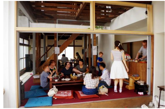
世界の朝ごはん（町内会&NPO）