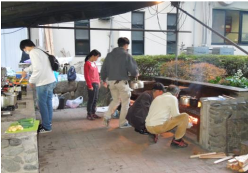
野外炊事体験（自治会町内会&地区社協）