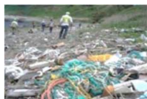
▲海岸での漂着ごみ（環境省）