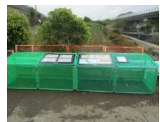
▲折り畳み式ネットボックス