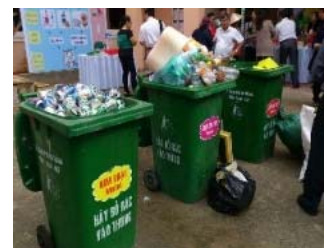
▲ベトナム・ダナン市での分別支援協力