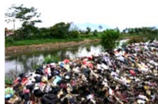
▲海外のプラスチックごみの状況（環境省）