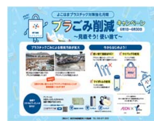
▲キャンペーンポスター