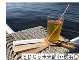
▲木製ストローの普及