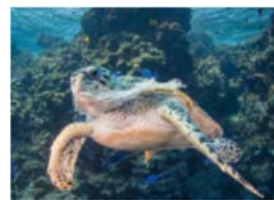
▲海洋生物への影響（環境省）