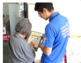
▲イベントでの啓発