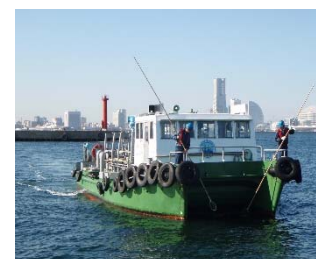
▲海上漂流物の回収