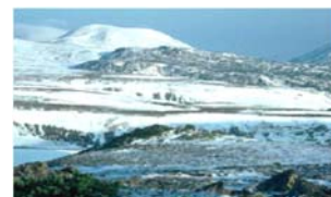
▲地球温暖化の状況（環境省）