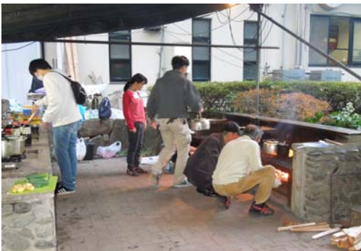
野外炊事体験（自治会町内会&地区社協）