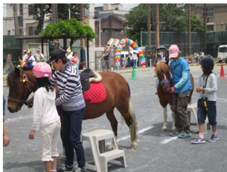
ポニー乗馬体験（自治会町内会&活動団体）