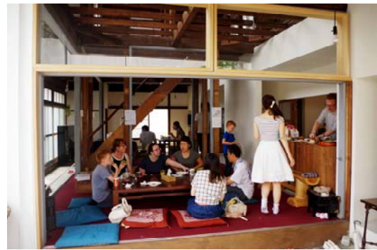
世界の朝ごはん（町内会&NPO）