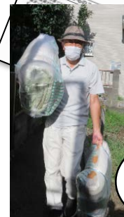
藤棚ハイツ 支援の会