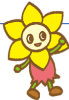
にしまろちゃん 西区マスコットキャラクター